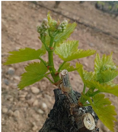
F5. Racimos visibles. ATRIA Fuendejalón

Este tratamiento coincide con el primer tratamiento preventivo contra oídio.