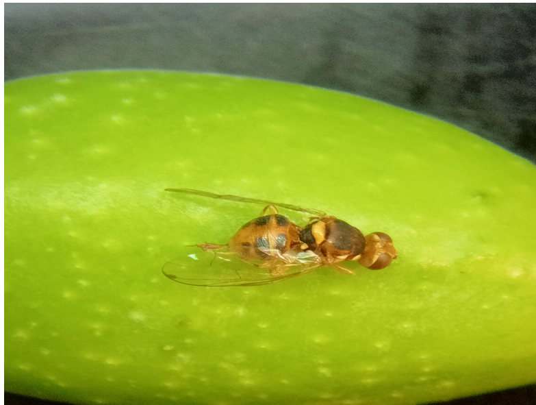
Mosca picando oliva

La semana pasada se colocaron las trampas cromáticas con feromona, todavía no hay capturas reseñables en ninguna comarca de Aragón.