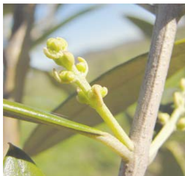
DI Predomina la corola