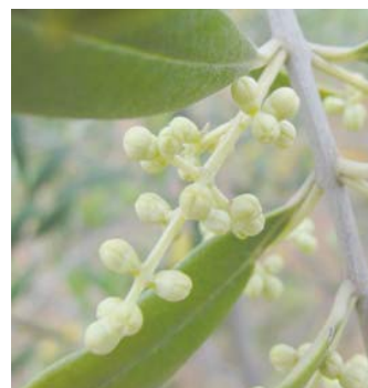
DII La corola cambia de color