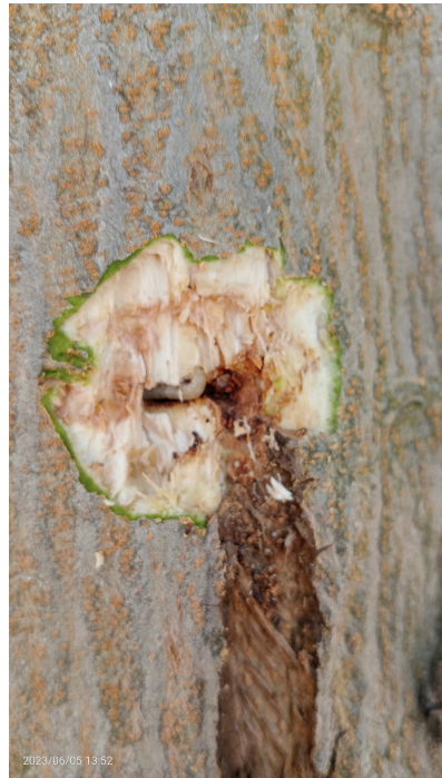
Larva en galería