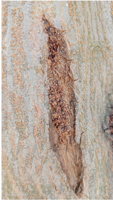
Excrementos en tronco