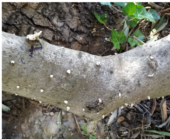
Tronco con entrada de Barrenillo

En caso de querer quemar los restos de poda, hay que hacerlo con el perfecto permiso y que el mapa de índice de riesgo por uso de fuego lo permita, antes del 31 de mayo. En caso de triturar los resto se puede hacer durante el mes de junio.