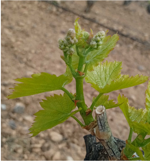
F5. Racimos visibles. Seis hojas separadas. Garnacha en Fuendejalón (BORJA BAJA). 05/04/2024