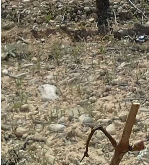
B3. Yema hinchada. Apertura de escamas. Cabernet Sauvignon en Tosos (CARIÑENA ALTA) 03/04/2024

TEMPRANILLO: El estado fenológico más atrasado es C. Punta verde. Brotación que se registra en BORJA ALTA y CALATAYUD NORTE, y en más adelantado es E3. Hojas extendidas. Tres hojas separadas.