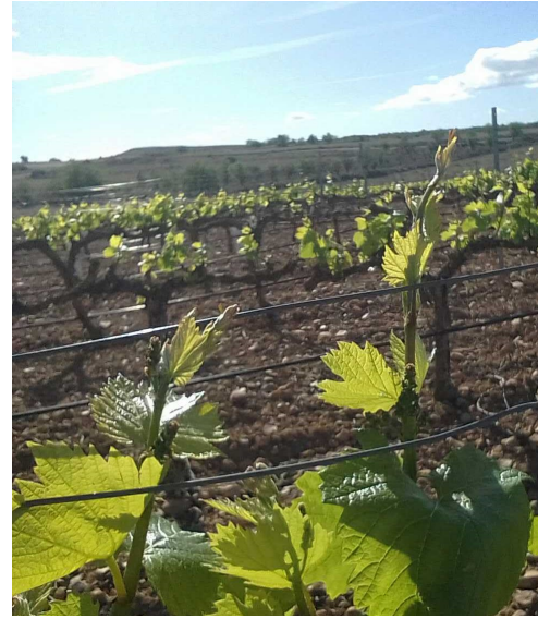
F6. Racimos visibles. Seis hojas separadas. Chardonnay en Alfamén (CARIÑENA BAJA) 03/04/2024