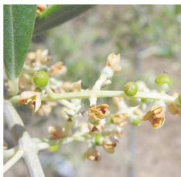
G Fruto Cuajado

En la comarca de Bajo Aragón-Caspe ya se han encontrado parcelas con el estado fenológico H endurecimiento de hueso, en esta próxima semana se dará prácticamente en el resto de comarcas, sobre todo en las mas orientales.