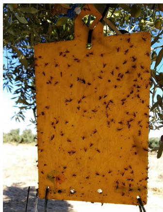
Placa cromática con capturas de mosca