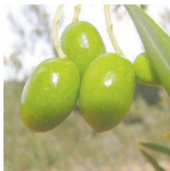
H Endurecimiento de hueso