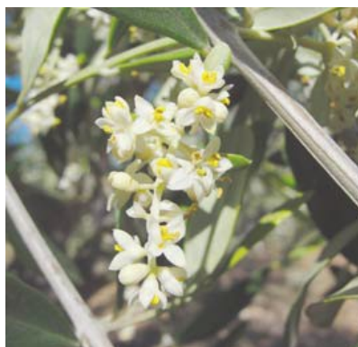
F2 Plena floración