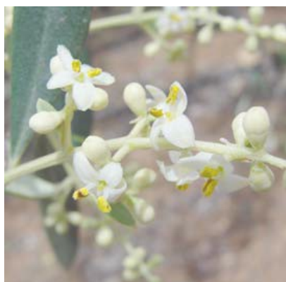
F1 Inicio floración

La totalidad de las comarcas están en floración, las mas tempranas finalizando floración, con algunas parcelas ya con caída de pétalos y fruto cuajado.