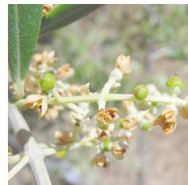
G Fruto cuajado