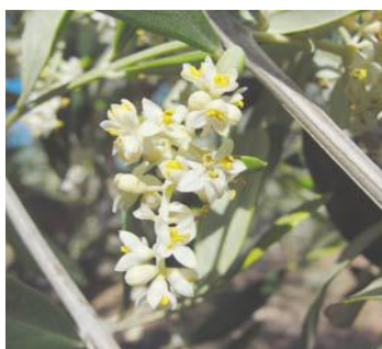
F II plena floración