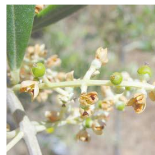
G fruto cuajado