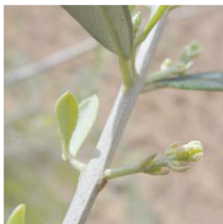
C Formación racimo floral